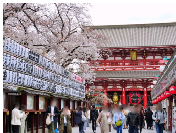
浅草寺・仲見世の桜 (イメージ)