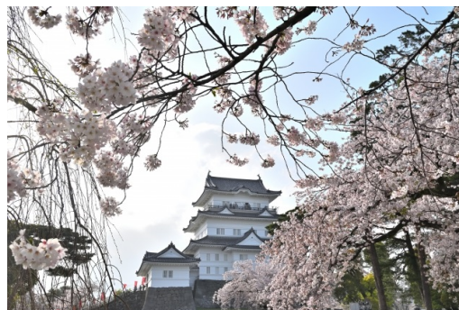
小田原城址公園の桜 (イメージ)