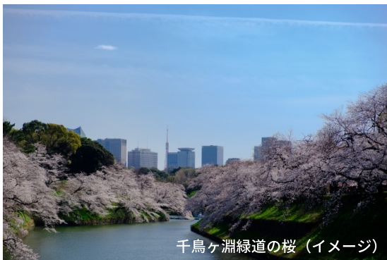
千鳥ヶ淵緑道の桜 (イメージ)