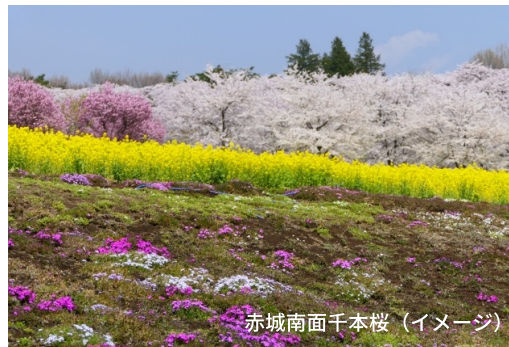
赤城南面千本桜 (イメージ)